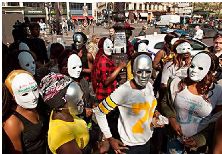
Марш секс-работников из STRASS, Франция