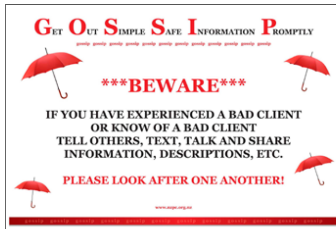
Постер ‘Давай посплетничаем!’, размещенный в центре для секс-работников в Новой Зеландии

В США существует множество местных и национальных списков плохих клиентов. В госпитале Св. Джеймса в Сан-Франциско было разработано приложение для телефона, 5 при помощи которого можно отправить сведения о плохом клиенте онлайн и получить доступ к информации на 18 языках.