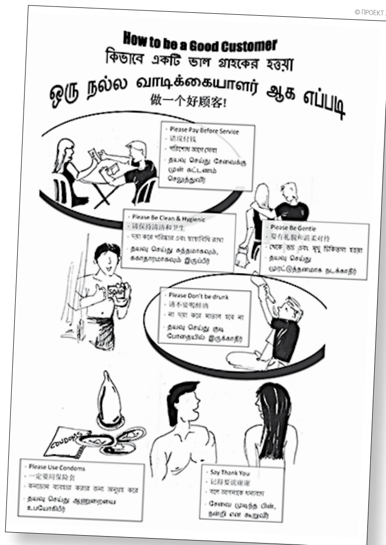
Плакат “Как быть хорошим клиентом” на нескольких языках, который используют в Сингапуре