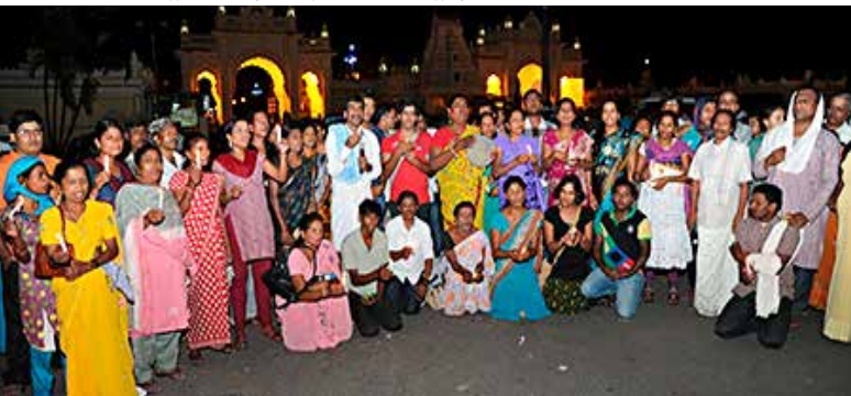
Протест со свечами против насилия над секс-работниками в Майсоре, Индия