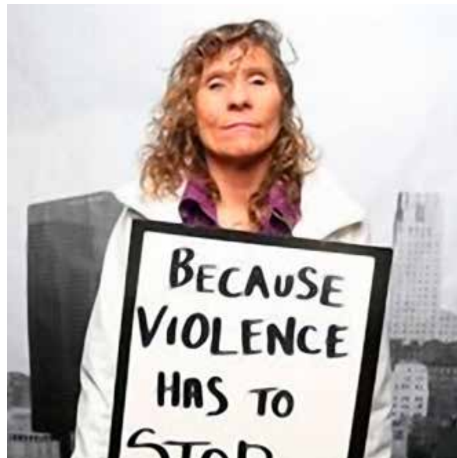
Члены объединения Peers Victoria в день Красного зонта в Канаде

Стигма, дискриминация, уголовное преследование секс-работы и коррупция в рядах полиции – все это способствует совершению актов насилия над секс-работниками. Насилие затрагивает секс-работников сильнее других людей, особенно если они экономически уязвимы или одновременно принадлежат и к другим маргинализированным группам, таким как геи или другие мужчины, ведущие половую жизнь с мужчинами, лесбиянки, трудовые мигранты, трансгендерные люди.