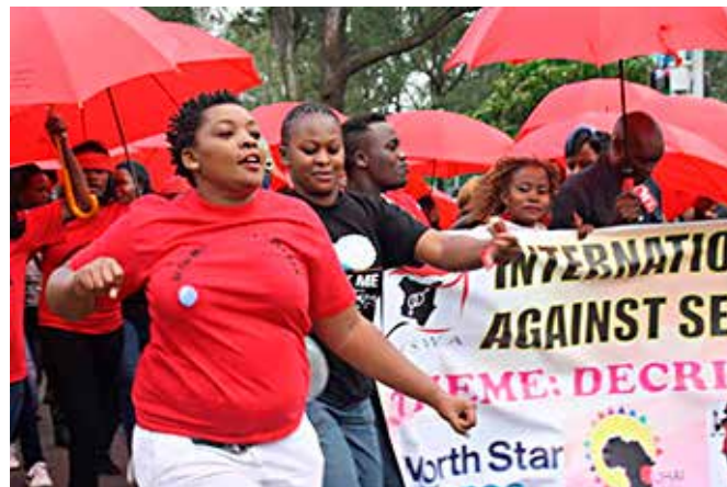
Шествие секс-работников Кении в Международный день борьбы с насилием над секс-работниками