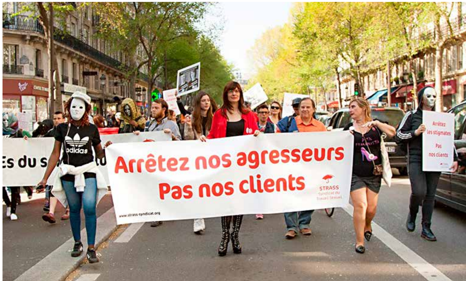
“Боритесь не с клиентами, а с теми, кто на нас нападает”- STRASS, Франция