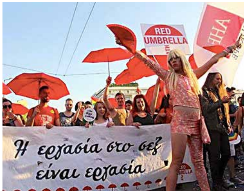
Секс-работники участвуют в прайде в Афинах в Греции

Секс-работники Южной Африки в партнерстве с центром гендерного правосудия “Сонке” опубликовали пособие для журналистов и писателей, где приводятся правильные определения, ключевые статистические данные и пояснения, что представляет собой проблема насилия. Организация “Легалайф-Украина” обучает журналистов и планирует разработать региональное пособие для журналистов касательно того, как писать о секс-работе.