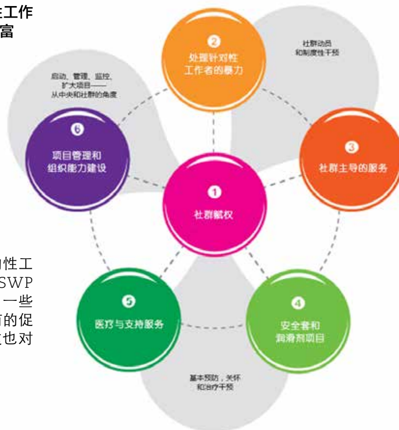
SWIT: 面向性工作者开展以权利为基础的项目六个要素

一些捐赠者对资助实证基础的性工作者主导项目有更浓厚的兴趣，NSWP的成员在2016年可能会由此获益。一些政策决定这承诺将尊重并推动现有的促进性工作者权利的政策和协定，这也对组织有益。